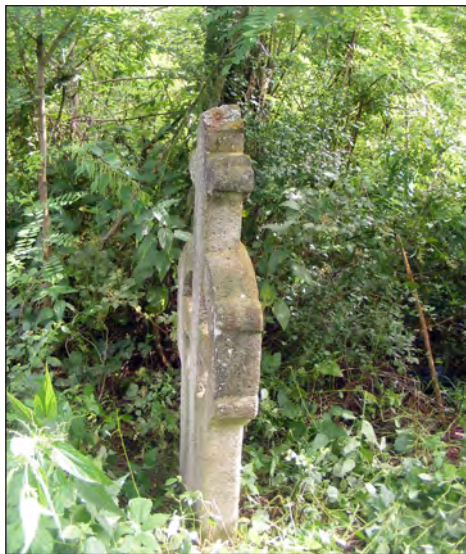
Слика 9. Камени крст и култни багрем на култном месту Ђурђевдан у дејанском засеоку Прагџн (фото: Дејан Крстић, 1. јул 2018)