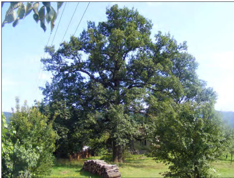
Слика 6. Безимено култно дрво у дејанском засеоку Прагџн