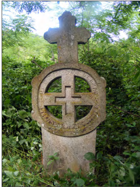
Слика 8. Камени крст на култном месту Ђурђевдан у дејанском засеоку Прагџн (фото: Дејан Крстић, 1. јул 2018)